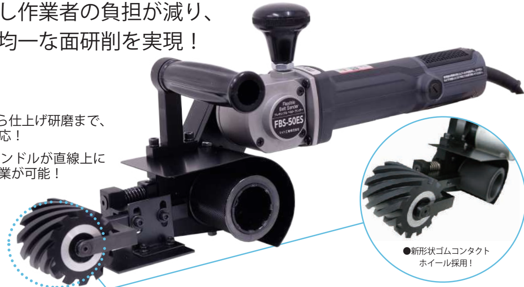
●新形状ゴムコンタクトホイール採用！